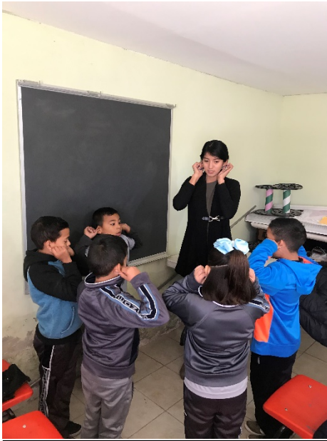
Concientización a padres de familia